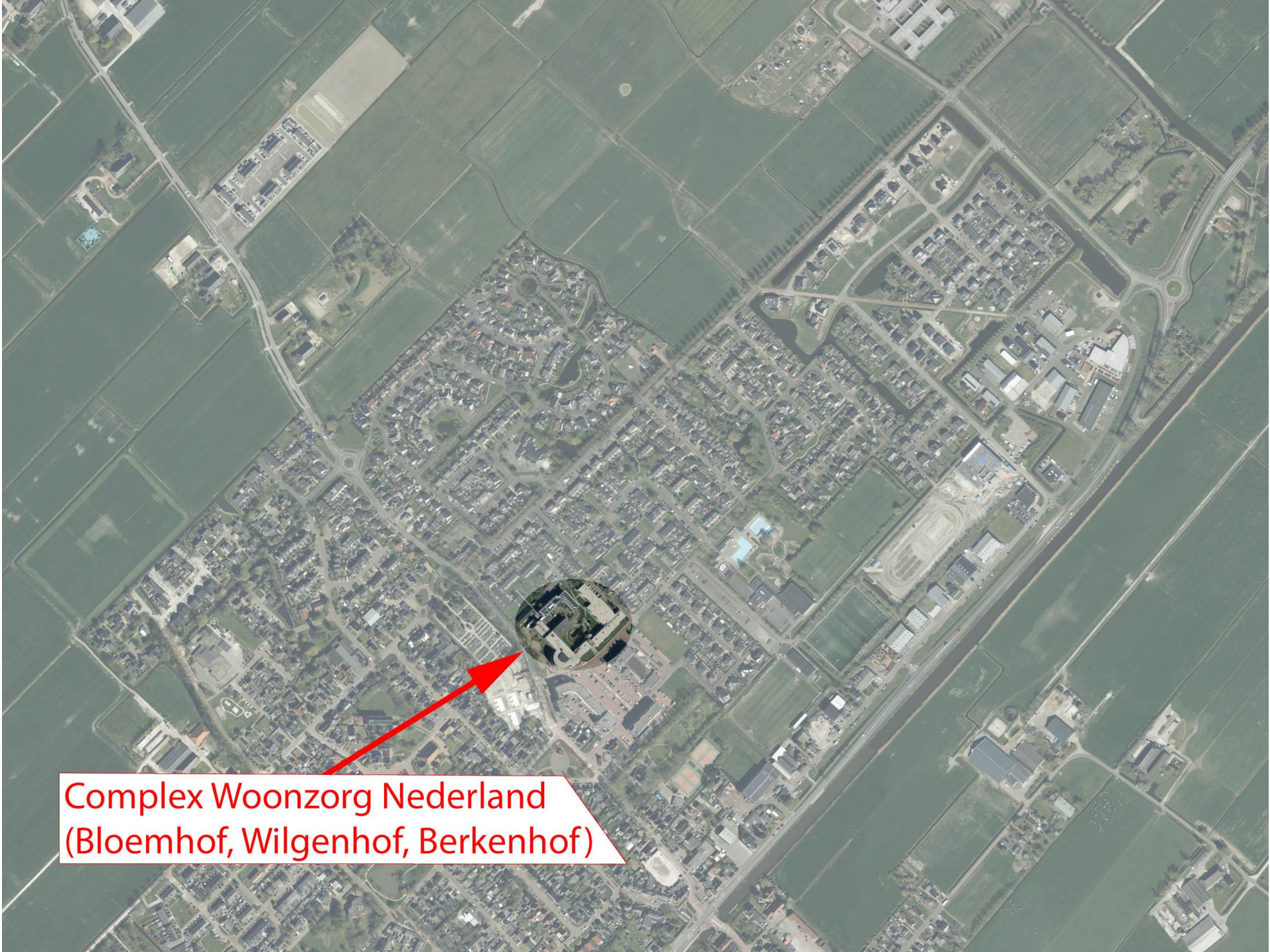
Complex Woonzorg Nederland (Bloemhof, Wilgenhof, Berkenhof)