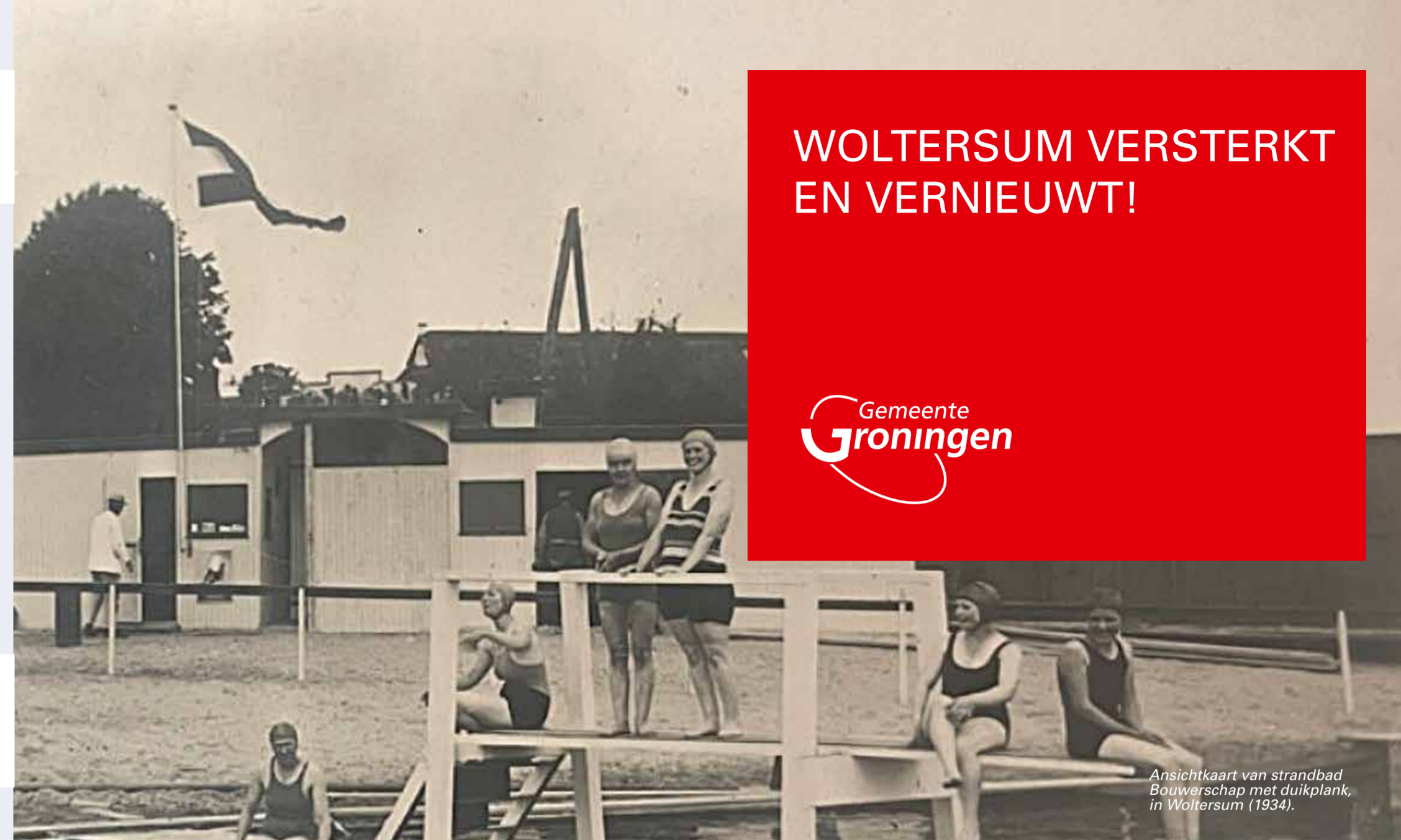
Ansichtkaart van strandbad Bouwerschap met duikplank, in Woltersum (1934).

Zijn dit geen geschikte tijden voor u? Maak dan gerust een afspraak op een ander tijdstip. Dat kan via uw bewonersbegeleider van NCG, uw zaakbegeleider van IMG en het team van Versterken en Vernieuwen, via mailadres: versterkenvernieuwen@groningen.nl .