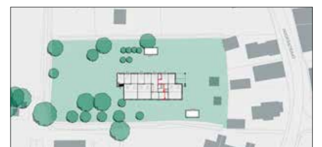
Situatieschets met globale positie van de school op terrein achter Hoofdweg 16