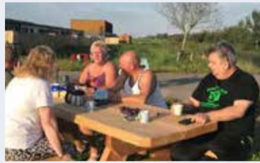
De picknickbank meteen volop in gebruik.

Vlak voor de vakantie kreeg de gemeente het verzoek om een picknickbank te plaatsen bij de tijdelijke woningen aan de Slenkweg. Het lukte met medewerking van de bewoners om dit nog voor de zomervakantie te doen. De picknickbank was meteen volop in gebruik. Dat was leuk om te zien.